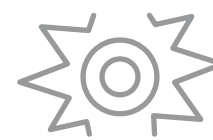
Đau dây thần kinh